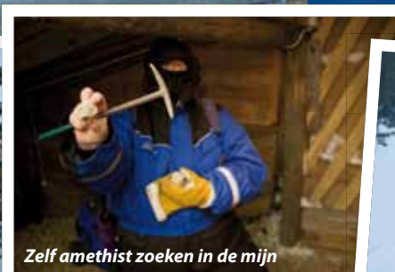
Zelf amethist zoeken in de mijn