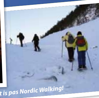
Dit is pas Nordic Walking!

enthousiasme waarmee ze vertellen over hun dieren en hun werk. Oh ja, ik heb zelfs nog heel stoer op een sneeuwscooter over de heuvels door de bossen gecrosst!"