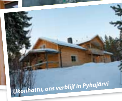
Ukonhattu, ons verblijf in Pyhäjärvi