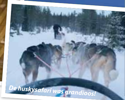
De huskysafari was grandioos!