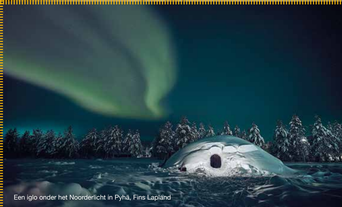
Een iglo onder het Noorderlicht in Pyhä, Fins Lapland