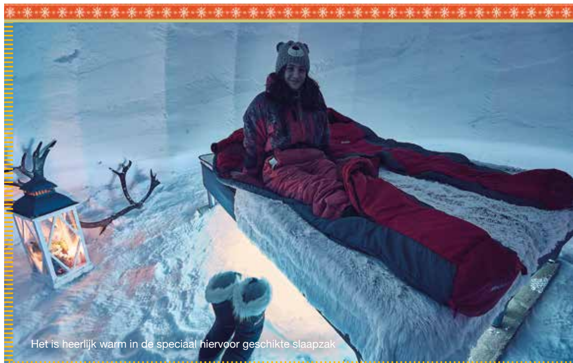
Het is heerlijk warm in de speciaal hiervoor geschikte slaapzak